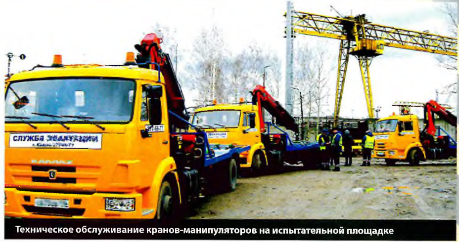
Техническое обслуживание кранов-манипуляторов на испытательной площадке

Импортная техника всегда привлекала пользователей. Но, прежде чем приобретать, надо знать, что требования